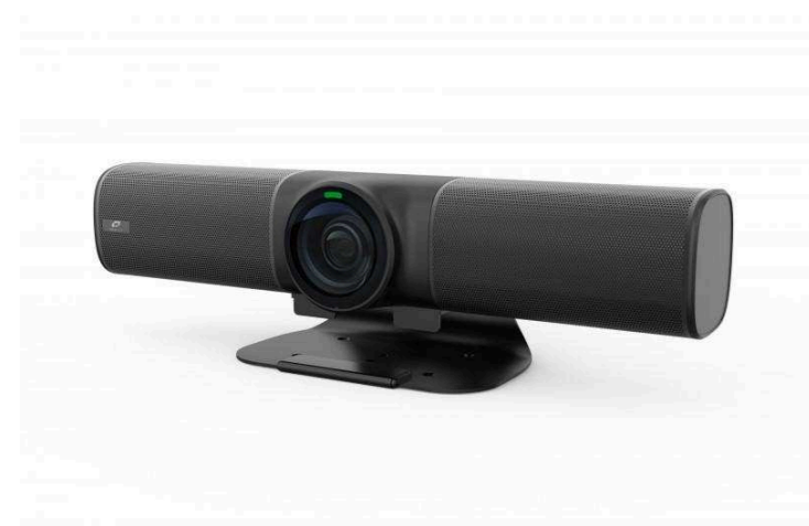
Видеосаундбары от 65 400 р.