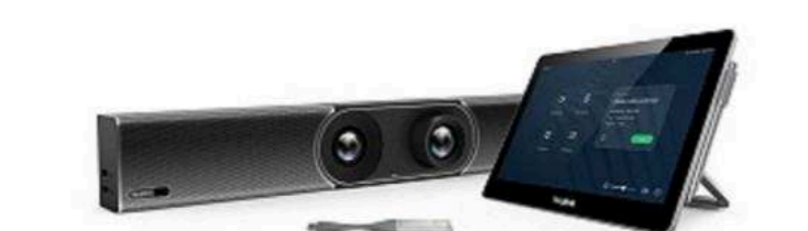
Видеотерминалы от 473 600 р.