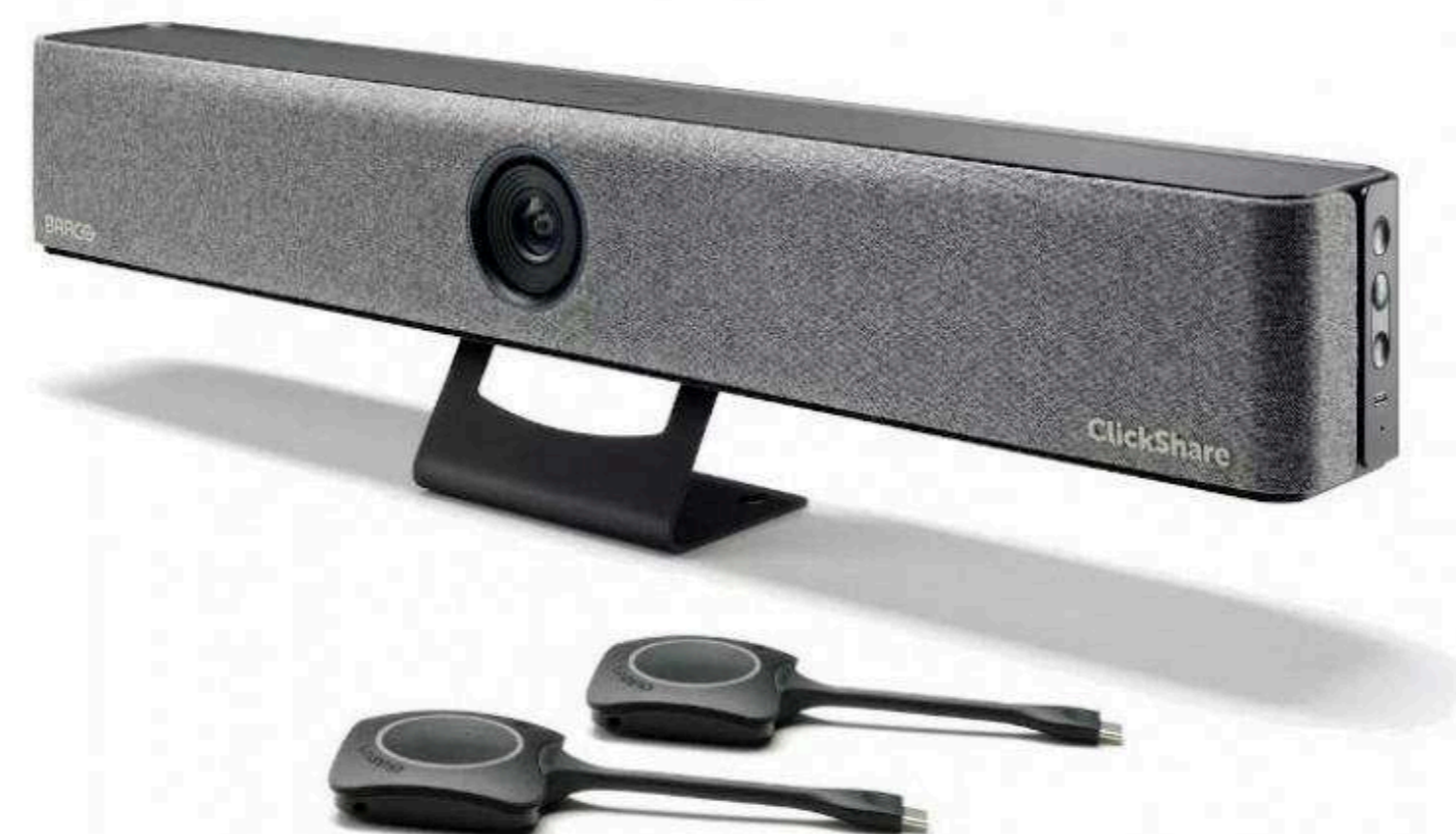
Видеобары премиум-класса Цена по запросу