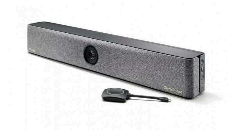
Видеобары для беспроводных конференций от 77 600 р.