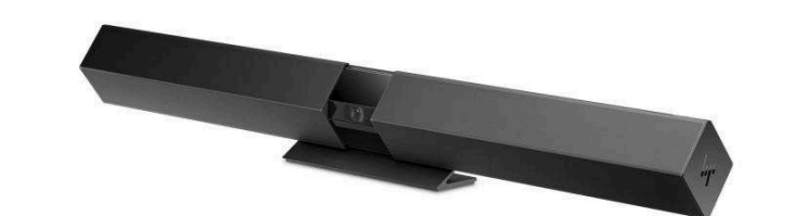
Аудио-видео бары от 104 100 р.