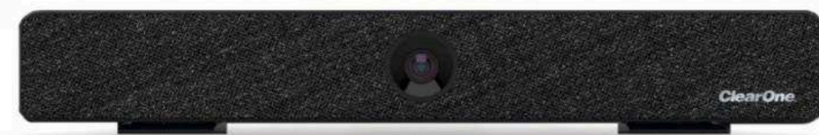
Медиабары Цена по запросу

Подберем оборудование точно под задачу по этим характеристикам: